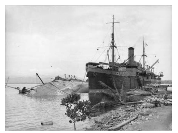
The merchant ship Anshun lying sunk in Milne Bay in September 1942, next to the hospital ship Manunda. The latter was not targeted in the Japanese naval attack.

1943年になっても日本軍は撹乱作戦を続けた。ニューギニアやオーストラリア北部で は、日本軍機による補給路への頻繁な攻撃がある一方、潜水艦による作戦はさらに南