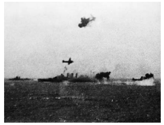
HMAS Australia under attack during the battle of the Coral Sea. Though losses on both sides were roughly equal it was a strategic defeat for the Imperial Japanese Navv.

その3日後、日本軍のポートモレスビー攻撃部隊の約6,000名の将兵は、空母や巡洋艦 や駆逐艦に護衛されてラバウルを出発した。クレイスの部隊は5月7日に、ジョマード 水道を通過しようとする日本軍の船団を阻止する任務についた。そこでは日本軍の艦 船とは遭遇しなかったものの、空からの激しい攻撃を受けた。5月7日から8日にかけ ての珊瑚海海戦は、海軍戦史上初めて、相対する艦船が互いに相手の姿を見なかった 戦いであった。航空母艦とその護衛艦が主要な役割を果し、双方ともそれぞれ空母1隻 が沈没し、もう1隻が被害を受けるという結果になった。大きな損害はなかったもの の、この対決は日本にとって戦略的敗北であった。日本海軍は珊瑚海の制海権確保に 失敗し、海上の掩護力が激減し制空権が弱まったため、ポートモレスビー攻撃作戦は