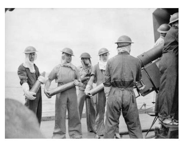
Gunners from the corvette HMAS Geelong fire on Japanese positions in late 1944. Naval support played a vital role in the Allied counter-offensives in New Guinea.

Despite often possessing the advantages of position and preparedness, the majority of Japanese troops in New Guinea were never to come to grips with Allied forces. Subjected to what was, essentially, an extremely effective blockade, enemy troops suffered terribly from illness and malnutrition. Claims have since been made that deaths in combat account for only 3 per cent of the 100,000 Japanese who died in New Guinea. Those on the ground were under no illusions. One of the few Japanese survivors of Buna was